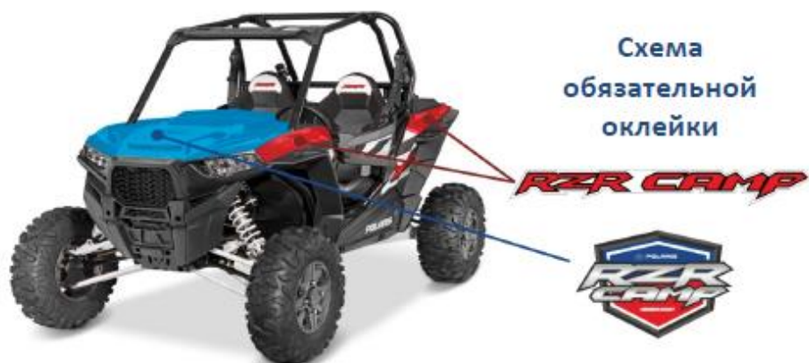
СХЕМА ОКЛЕЙКИ ATV